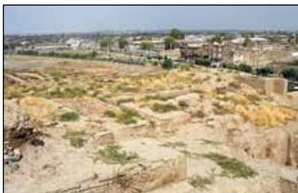
העיר חמדאן או אבקטנה, שמו של הכפר בתירא כיום

אך יש הסבורים, כי סתם 'בן בתירא' הוא רבי יהודה בן בתירא.