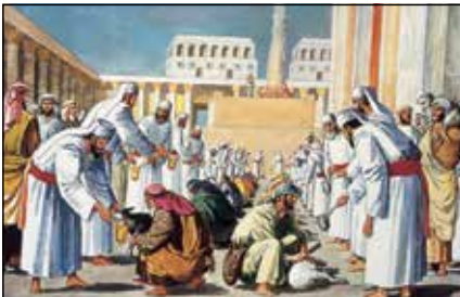
מעמד הקרבת קרבן הפסח