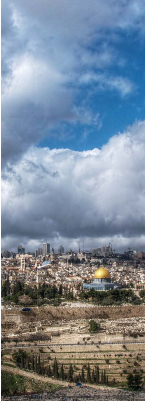
הר הבית, מבט ממזרח

לתיקון העולם, לעתים גם על ידי התרחקות והענשת עושי העוול. בורא כל בני האדם בצלמו, הוא שציווה על מלחמה ברשעי עולם.