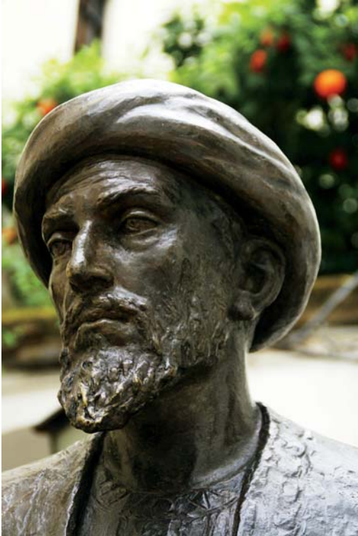
פסל מברונזה של הרמב"ם בקורדובה ספרד

יסודות המנוסחים בשפה האנושית ובמושגי החשיבה האנושית, והתנ"ך מגיע כדבר ה' אל האנושות. 3 ראש המאמינים הוא אברהם אבינו שנולד לתוך עולם אלילי וגילה בכוחות עצמו את האלוקים. התנ"ך אינו מבאר כיצד הגיע אברהם לאמונה זו אלא פותח בתיאור תולדות אברהם סמוך להתגלות ה' אליו. חסדיו של אברהם, דבקותו בה' ועמידתו בניסיונות שונים, מלמדים על עוצמת אמונתו ועל הדרך הראויה למאמין היהודי.