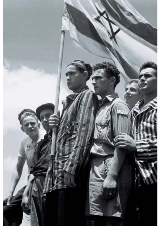
ניצולי שואה בדרכם לישראל

מדינת ישראל תומכת באופן פעיל ביותר בכל החפצים להתגייר, ורואה בהם בנים חוזרים, 'זרע ישראל', השבים ומתקבצים אליה ומתחברים לעם היהודי המחפש בה את חייו. רבים מהם ראו עצמם בארצות גלותם כיהודים, הזדהו עם העם היהודי, ומתוך כך עלו לארץ והם חפצים להשלים את ההליך ההלכתי והרוחני שישדיר סופית את זהותם. בסיום תהליך הגיוור מקבל המתגייר ממדינת ישראל 'תעודת