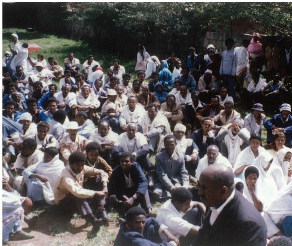
במתחם הקהילה באדיס-אבבה, 1991

השניים הם חברי הקהילה שעלו ארצה, חזרו כשליחים אל אחיהם הממתנים, ושהו עמם בחגים באדיס-אבבה ובגונדר.