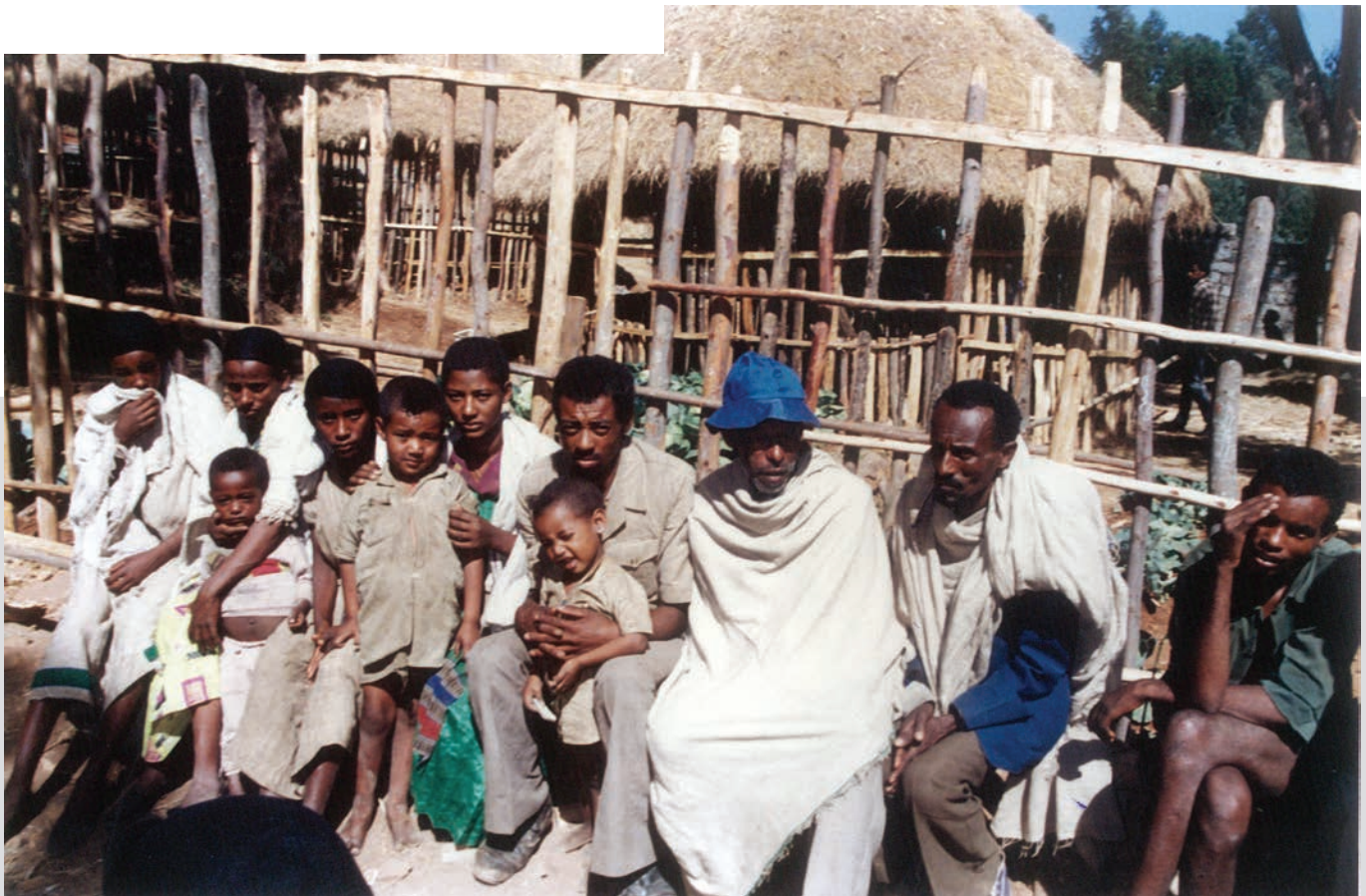
משפחות שהגיעו מן הכפרים במתחם שגרירות ישראל באדיס-אבבה, 1990