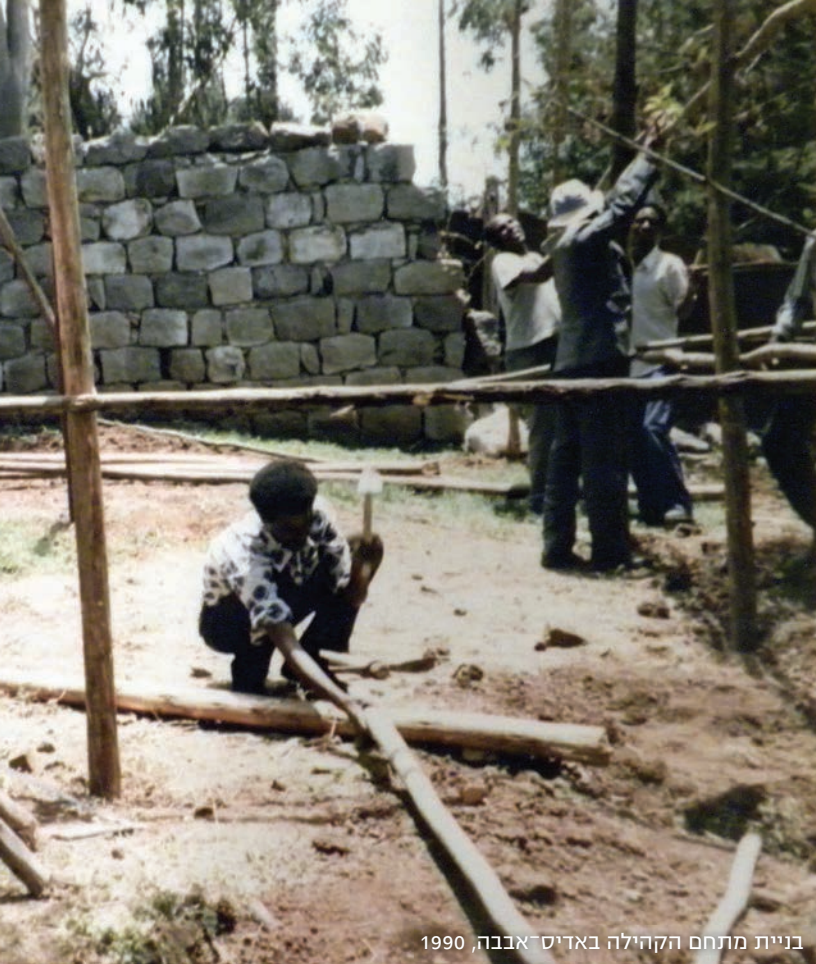
בניית מתחם הקהילה באדיס־אבבה, 1990