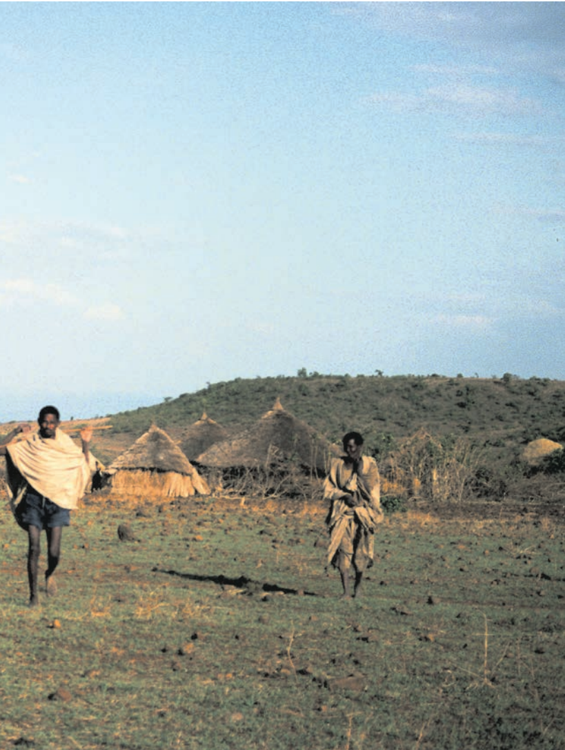
בכפר רובג'יה, 1992