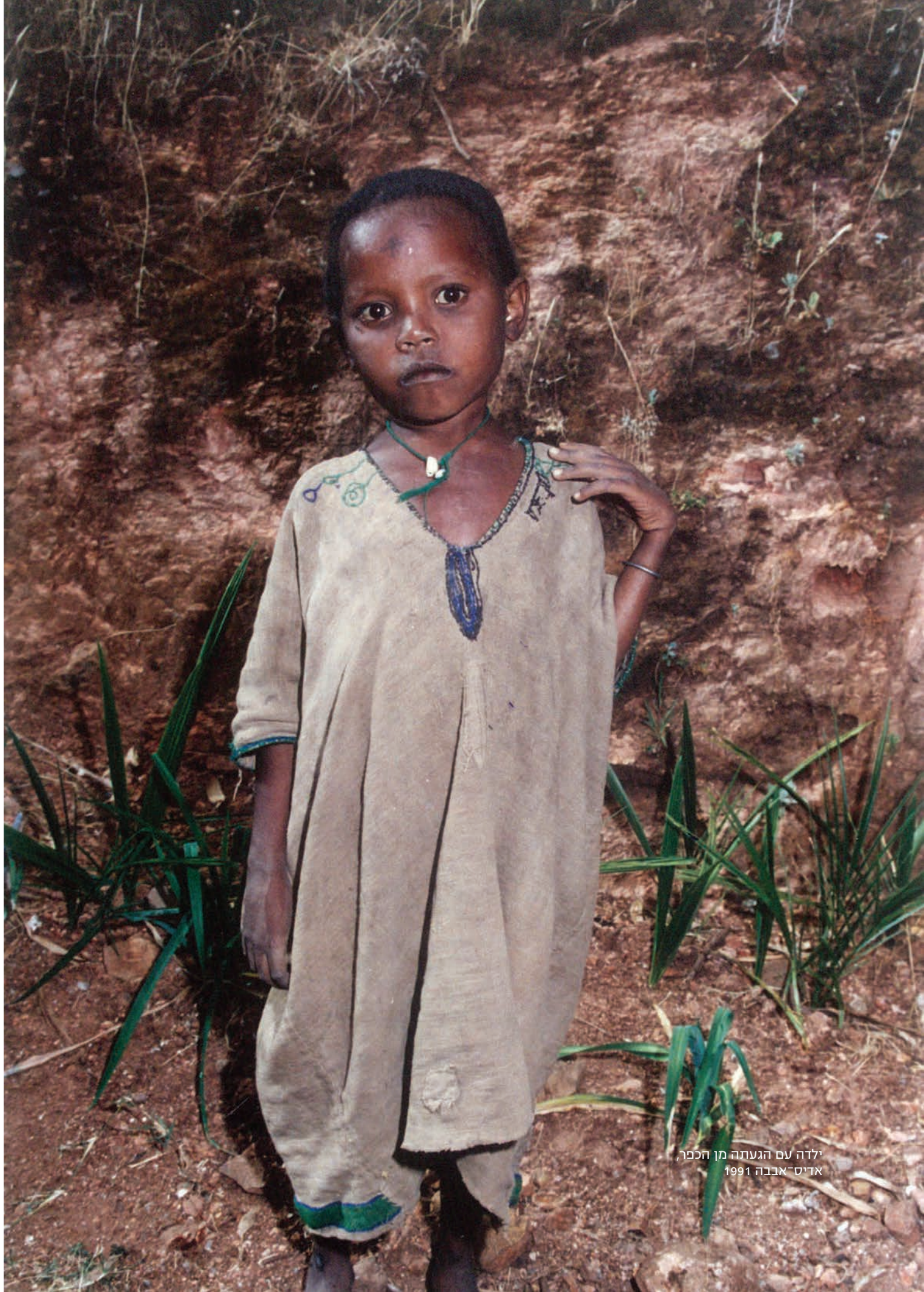
ילדה עם הגעתה מן הכפר, אדיס-אבבה 1991