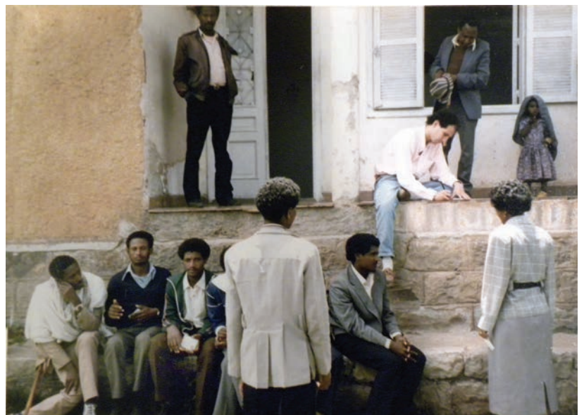
במשרד הראשון של אָרְגוֹן נַאקוּג', אדיס־אבבה 1990