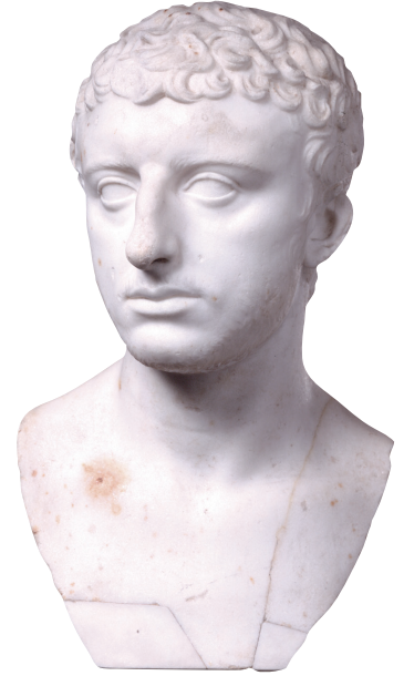
פסל רומי המציג, על פי ההשערה, את דמותו של יוסף בן מתתיהו. כיום מוצג במוזיאון בקופנהגן, דנמרק

יוספוס היה בקי במהלכי המרד, הן בתור מפקד הגליל, שתכנן את הגנת הגליל, הן בתור מי שליווה את הצבא הרומי בהמשך המרד והיה עד ראייה למצור על ירושלים עד כיבושה בשנת 70 לסה"נ. נוסף על כך, עמדו לרשותו מסמכים המתעדים את המרד.