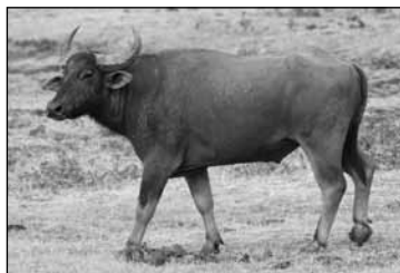
תאו מים ('מריא')?

לפי דעה אחרת הנשענת גם על המצוי באוגריתית, המריא אינו סוג מסוים אלא הוא שם כולל לבהמות מפותמות (ראו להלן יא,ו ויחזקאל לט,יח).